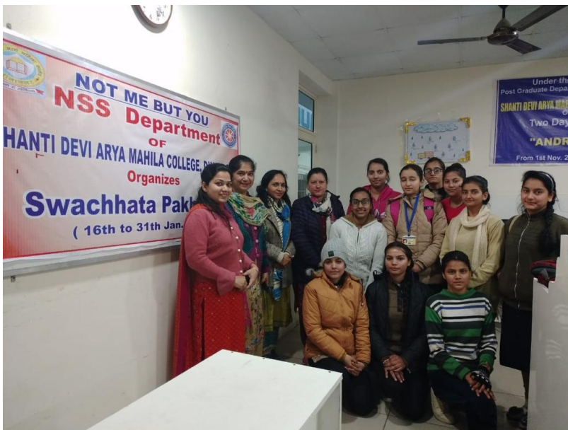
students and Faculty