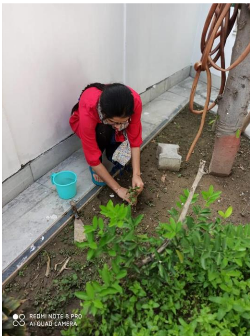
Each one Plant One Campaign by students