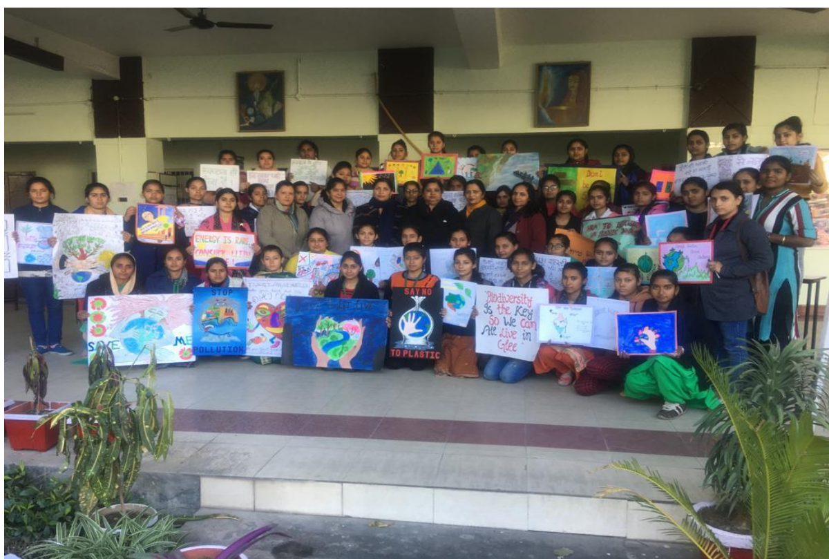
Students participating in poster making competition on Swachhta Action Plan 2020-21