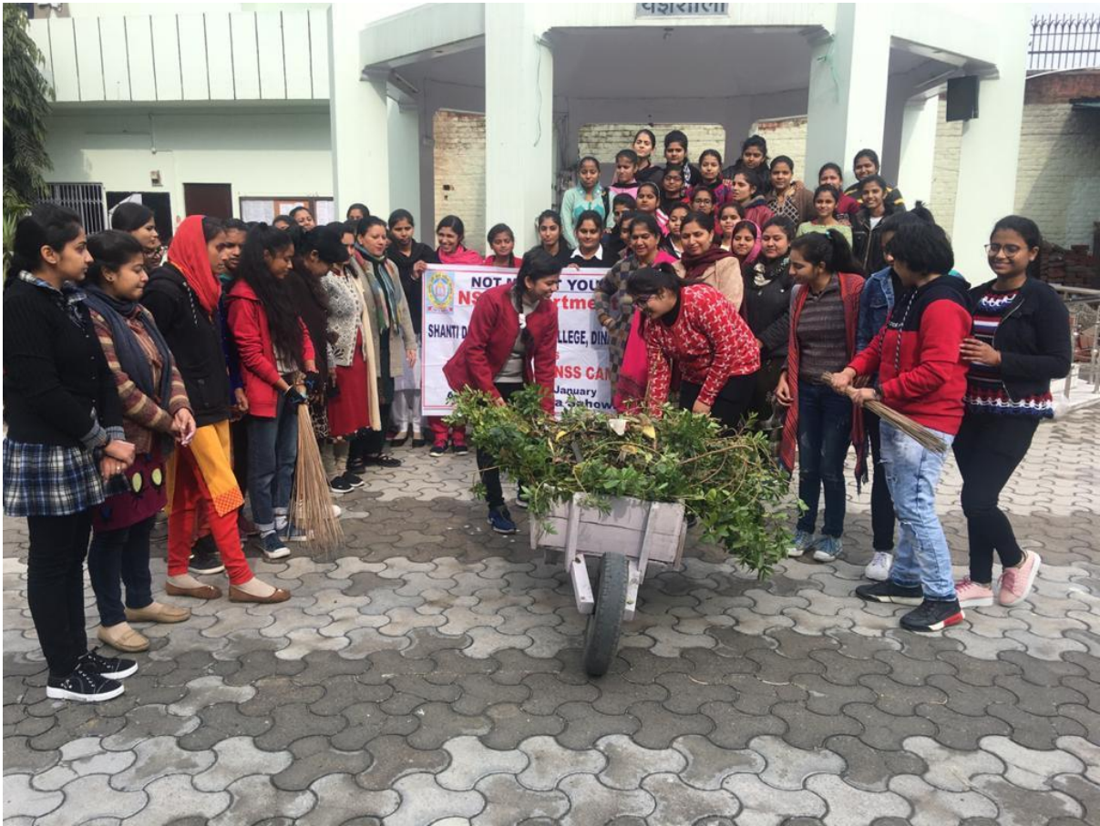
Cleanliness Drive by Students in the College campus