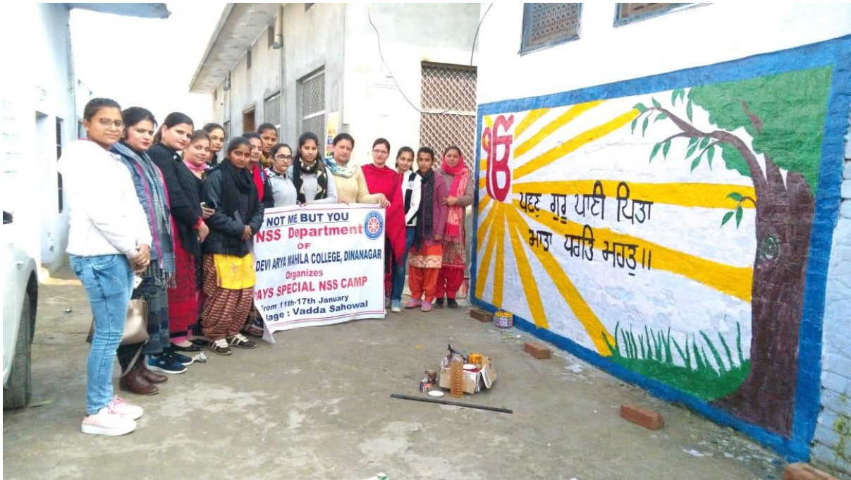
Message painted on wall of Gurudwara at Vada Sahawal