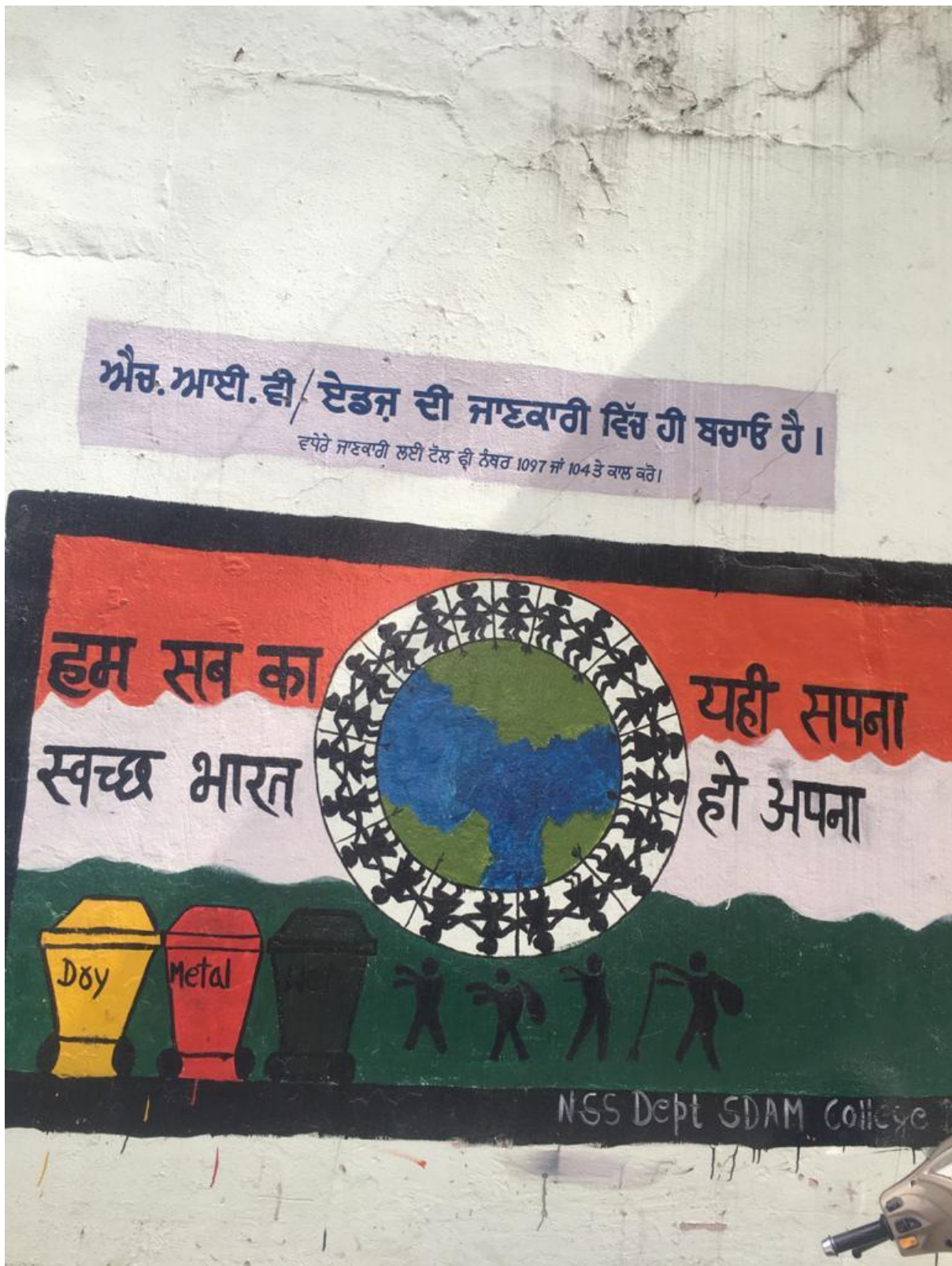
Cleanliness message painted on entrance wall of college