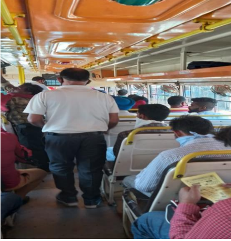
College Staff Distributing pamphlets to create awareness about Covid-19 among public