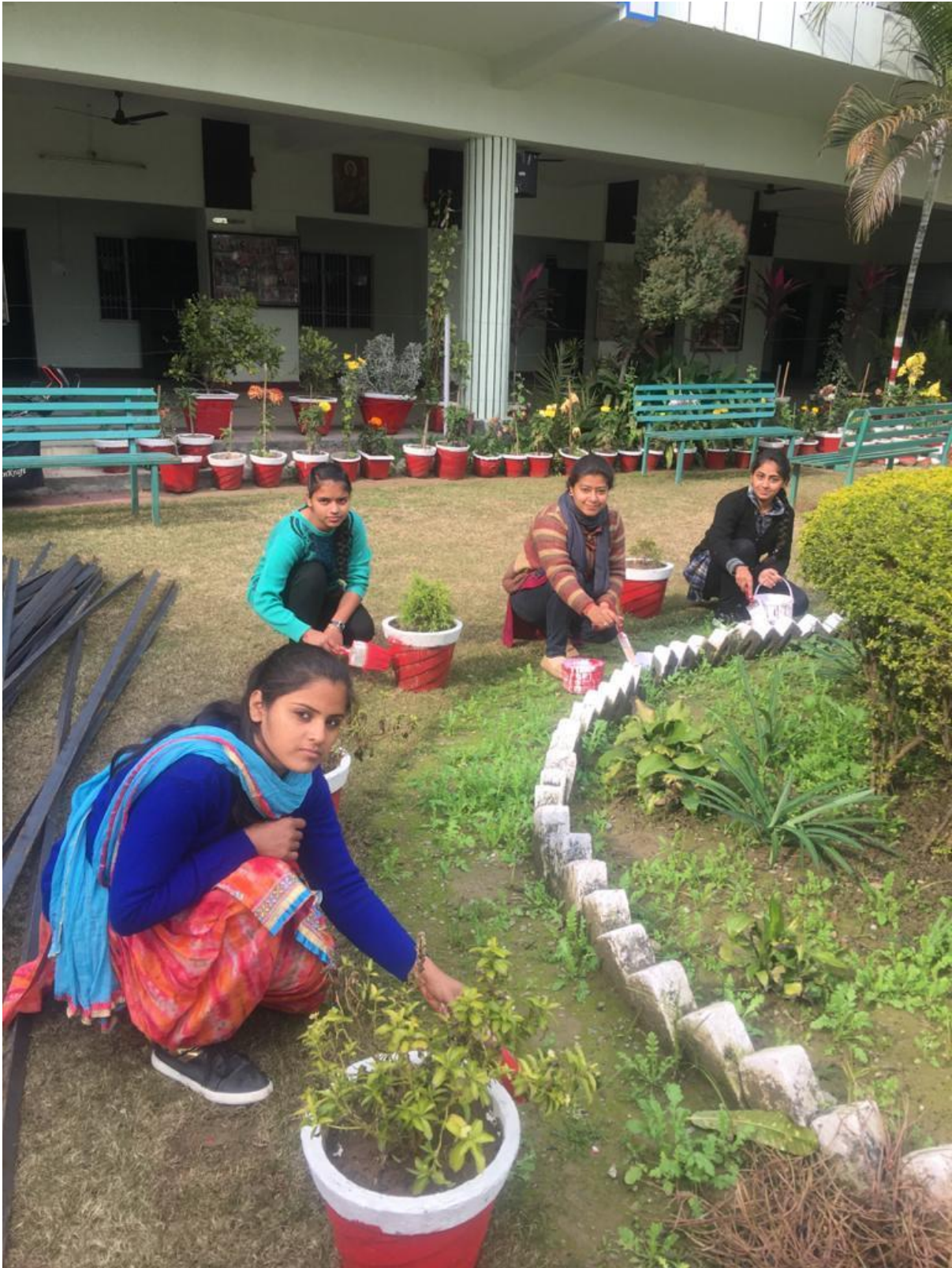
Preparing soil for Tree plantation