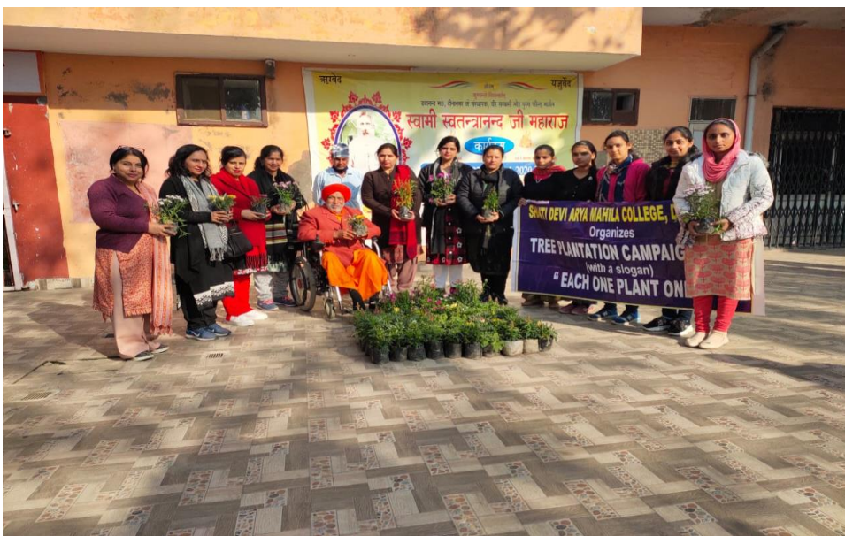
Plants Saplings donated at Dayananad Math, Dinanagar