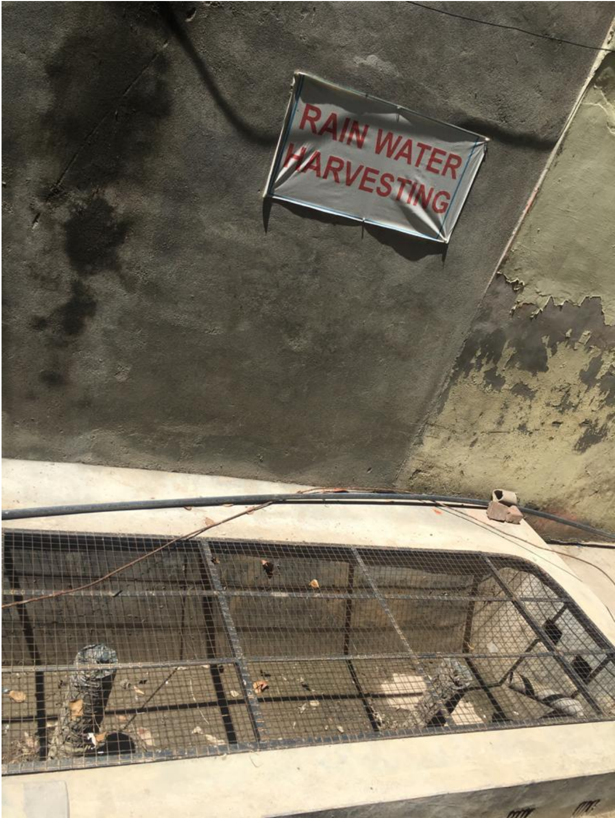
Rain water harvesting