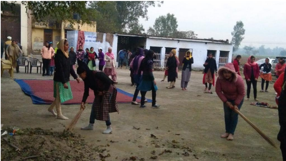
Cleanliness drive by students in adopted village Vada Sahawal