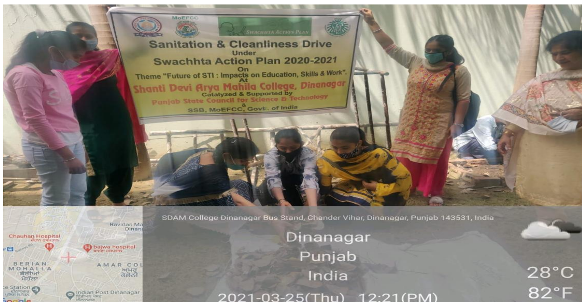
Students collecting fallen leaves for solid waste management