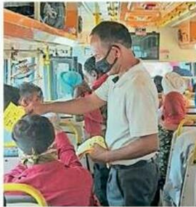
बस में पंप्लेट बांटते कॉलेज का कर्मी।